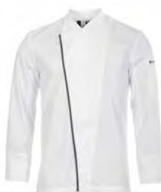
SPOON P. 60