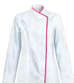
INTUITION P. 18