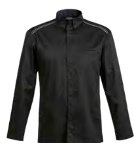
YAMATA P. 71