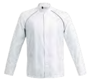
FORZA P. 74