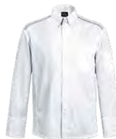
YAMATA P. 70