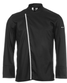
SPOON P. 61