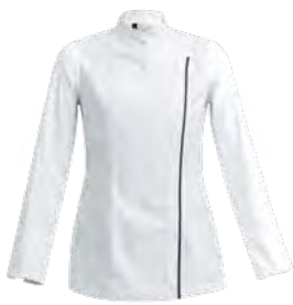
SIENNE P. 14