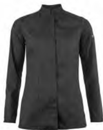
GENOVA P. 27