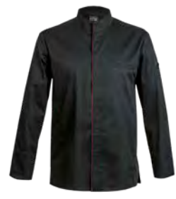
CATANE P. 33