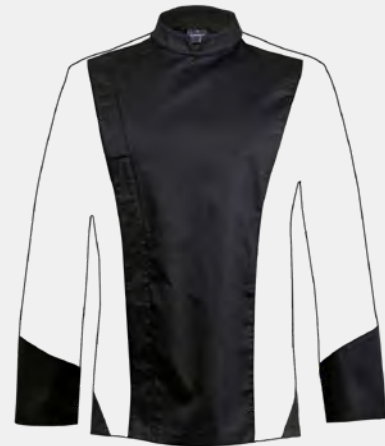
Plastron et poignets en poly-coton