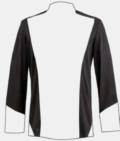
Corps en maille indéformable

The jersey fabric has been developed specially for professional use: the cotton inside for optimal skin contact comfort, the tightly woven polyester outside for colour longevity and an impeccable fit.