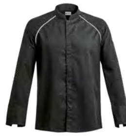
FORZA P. 75