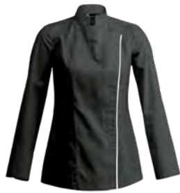
SIENNE P. 17