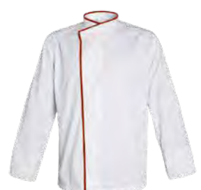
MADISON P. 19 / TOKYO P. 65