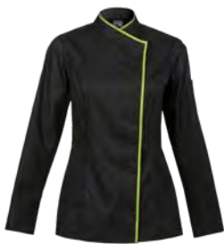
INTUITION P. 21 / SAPORE P. 62