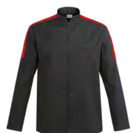
MANTOVA P. 26