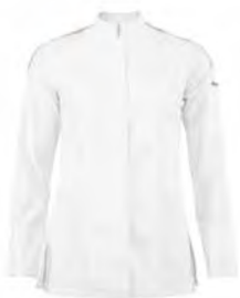
GENOVA P. 24