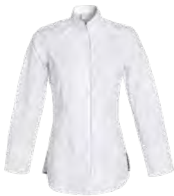
VALENCIA P. 31