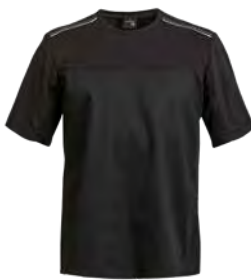
B-SHIRT P. 55