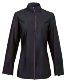
ALBA P. 32