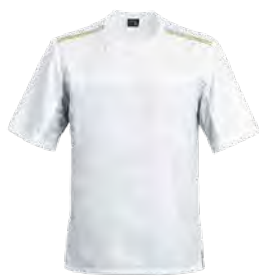
B-SHIRT P. 54