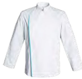
FIRENZE P. 15 / LIVERPOOL P. 52