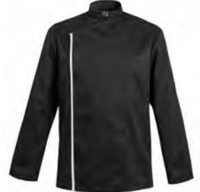
FIRENZE P. 16 / LIVERPOOL P. 53