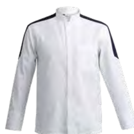
MANTOVA P. 25