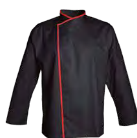
MURANO P. 20 / TOKYO P. 63